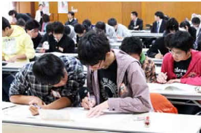
まずは筆記クイズに挑戦！