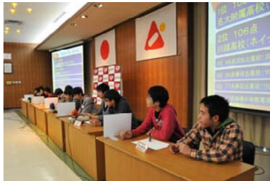
決勝ラウンドに進んだチーム