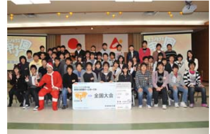
最後はみんなで記念撮影