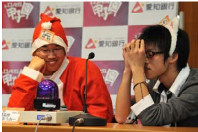
問題が難しいかな？