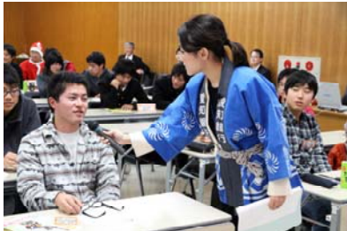
クイズの合間にインタビュー