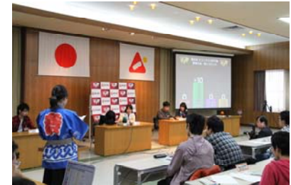
早押しクイズがスタート！