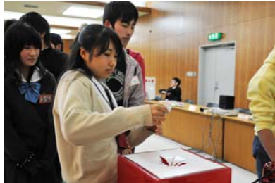
くじで対戦の組合せを決めます