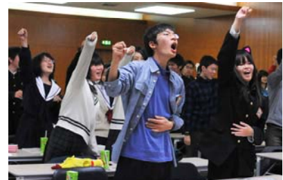
「NYに行きたいかー！オー！」