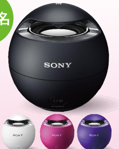
ソニー SRS-X1 [Bluetooth] ワイヤレスポータブルスピーカー ※お色は選択できません。