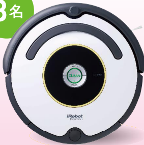
アイロボット ルンバ622