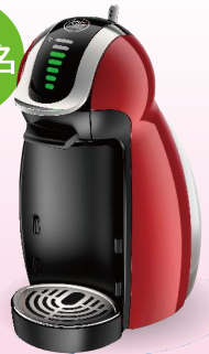
ネスレ ドルチェグスト ジェニオ2 プレミアム MD9771-WR