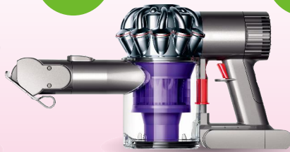
ダイソン ハンディクリーナー DC61 モーターヘッド