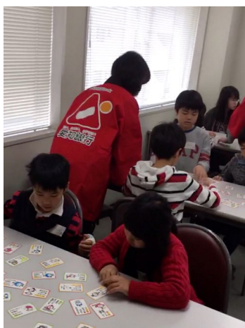
（1時間目 お金のお話）