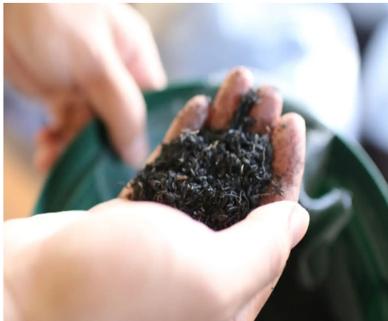
高機能バイオ炭 宙炭（そらたん）

当社では、温室効果ガス排出削減と、減化学肥料・有機転換を同時に実現する土壌改良材である、高機能バイオ炭「宙炭（そらたん）」を開発しました。宙炭とは、地域の未利用バイオマス（もみ殻や畜糞、樹皮など）を炭化したバイオ炭に、独自にスクリーニングした土壌微生物叢を添加し、地域で利用される有機肥料で微生物を培養しています。宙炭は、有機肥料に適した土づくりの期間短縮、農地への炭素固定、収量の向上などの効果があります。また未利用バイオマスを宙炭としてアップサイクルし農業に利用することで、持続可能な食料生産システムを実現します。