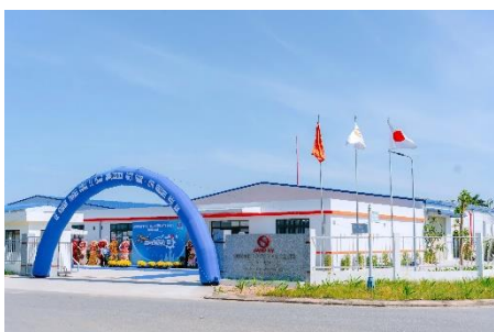
今回新築したベトナム現地法人第二工場

「ベトナムでの事業拡大にあたり、資金調達のスピードと手続きの煩雑さが課題でしたが、東南アジア他国での実績に基づいた的確なサポートにより、あいち銀行初となるベトナム現地法人向け融資を実現していただきました。地元の金融機関が日本と同じ温度感で海外拠点を支えていただけることは、グローバル展開を加速させる我が社にとって大きな安心材料です。」