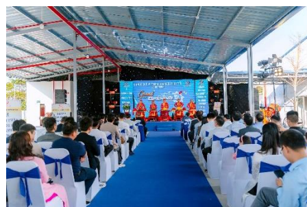
第二工場竣工式の模様